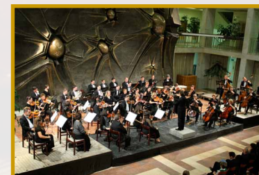
SZIE Aula 2010. november 6.