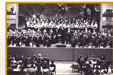
GATE Aula 1993.