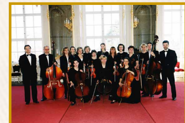
Gödöllői Királyi Kastély 2001.