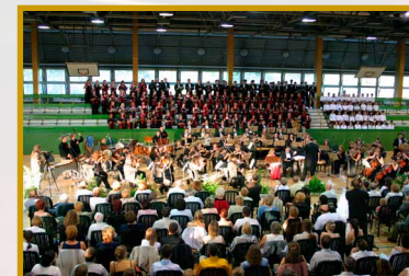
SZIE Sportcsarnok 2005. június.19.