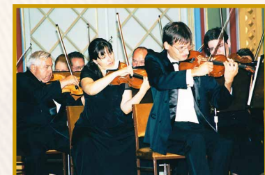
Pesti Vigadó, 2003. szeptember 7.