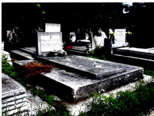
Dr. Márki Sándor (1853-1925)