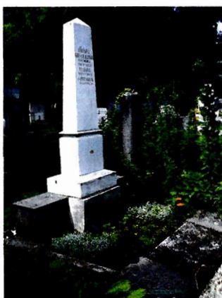
Körösfői Kriesch Aladár (1863-1920)