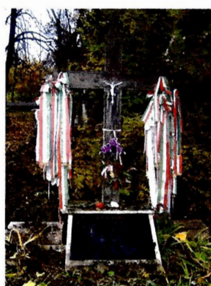
Gróf Teleki Pál (1879-1941)